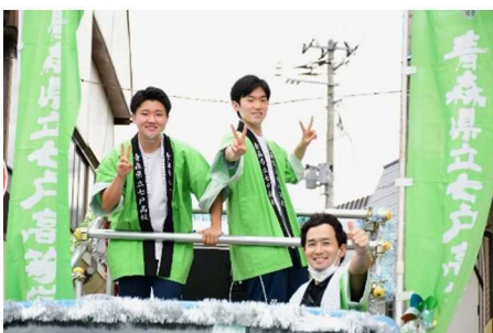
MCの東くん竹内くん