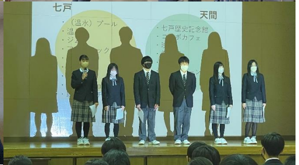
左上総合オリエンテーション(10.27)